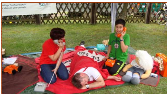
alles richtig machen...