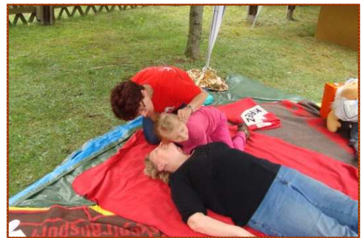
keine Angst haben...