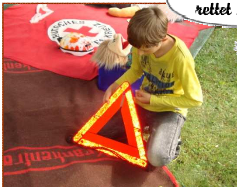
kennen lernen und ausprobieren...