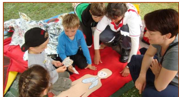
fasziniert sein ...